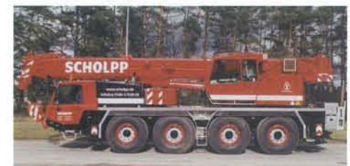
HK 70 auch mit Funk-Fernsteuerung bedienbar.