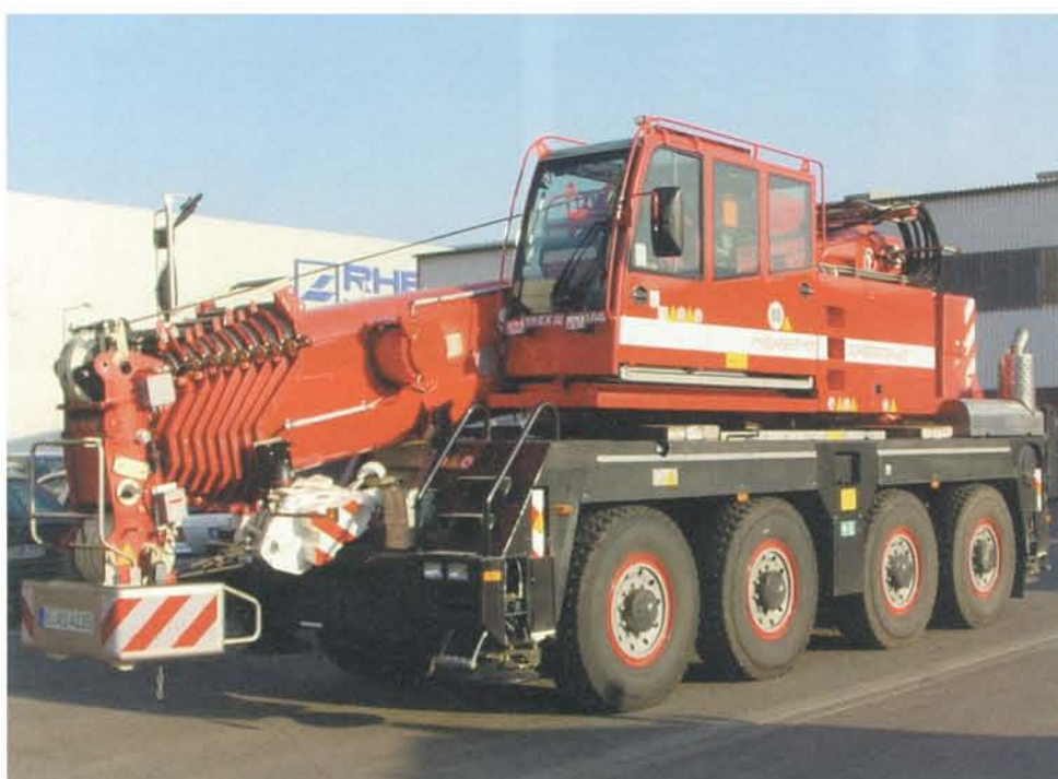
CityCrane – 4 ... natürlich auch mit Funk-Fernsteuerung.

Brandheiß und ganz neu sind gesamt drei CityKrane der 80-Tonnen-Klasse. Nicht nur, dass dieser Krantyp etwas anders aussieht, er ist auch extrem kompakt und wendig und das prädestiniert ihn für enge Innenstadtbaustellen genauso wie für Halleneinsätze.