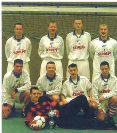
Im 7. Jahr die beste Platzierung mit Rang 4!

golfing, jedoch mussten sie sich gegen VW-Mosel geschlagen geben.