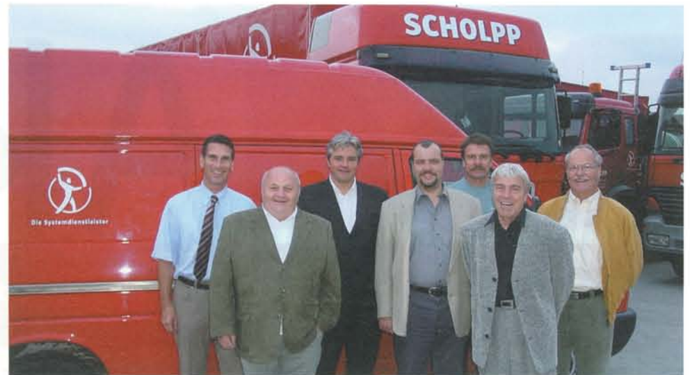
»10 Years after« ein Teil der Mitarbeiter vom '93er-Foto.