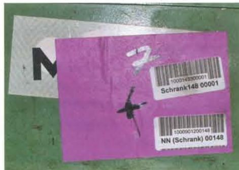
Alles immer unter Kontrolle mit »Barcode« System.