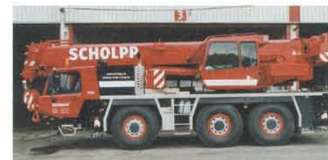
HK 50 und ...