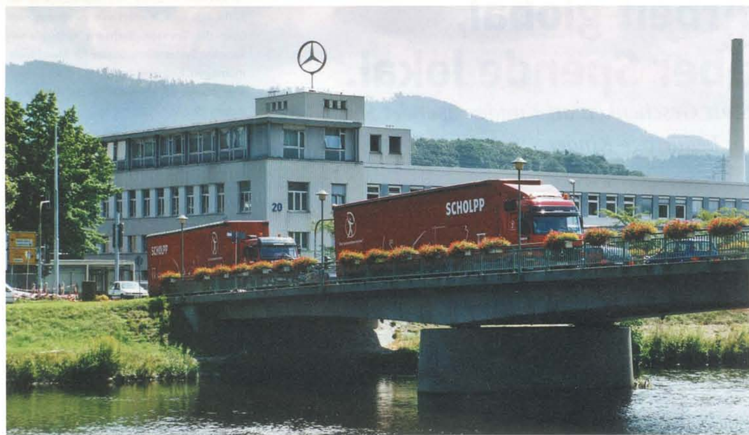
Gesamt 330 Überquerungen der Murgtal-Brücke waren für den Umzug erforderlich!